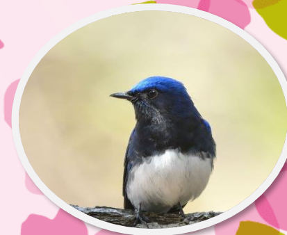
夏鳥として飛来するオオルリ 愛日荘園の近くにも飛来します！

隣接している富士病院さんの敷地内に咲く桜を吾妻山をバックに撮影しました！春の訪れと雪山のコーポレーション！