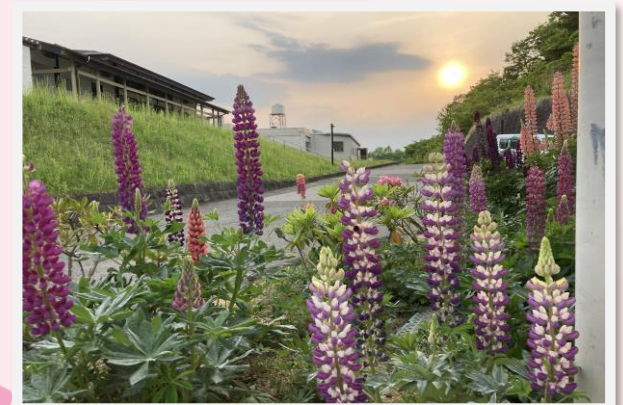
愛日荘園の敷地内でも春から初夏にかけて花が咲きます。その一つが、ルピナスです。縦長に花が咲いて個性的です。