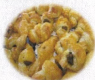
チョコクロワッサン