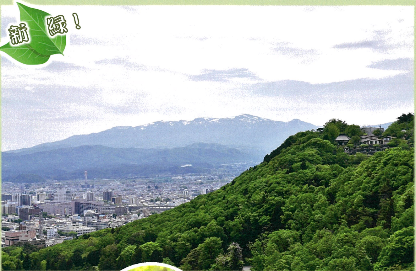
信夫山から安達太良連峰を撮影（平成30年5月6日）