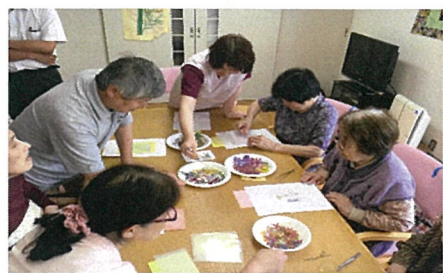
【前回のワークショップの様子】

6月より愛日荘園ふれあいギャラリーとして「出雲篤子・菅野瑞枝押し花二人展」を開催いたします。また、お二人を講師にお迎えし、押し花ワークショップも開催します。