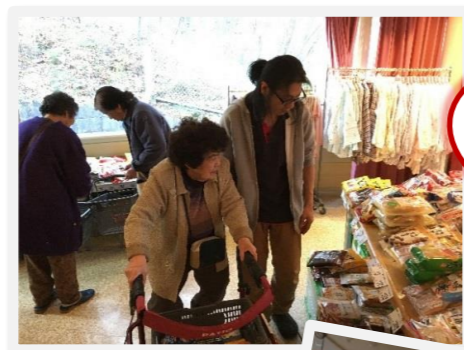
職員も一緒に お買物