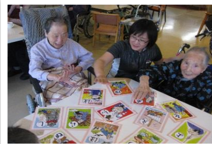
【かるた取りの様子】 「はいっ！」 「さすが、早いですね！」

特養ホームでは、お正月の三が日、恒例のお正月遊びを楽しみました。元日は気持ちも新たに「書初め」で幕開け。ご利用者様は思い思いのお正月にちなんだ文字を考え、書いていました。「今年は酉年だね」「正月といえば餅だよ」会話も弾みました。2日と3日はカルタや福笑いをしました。愛日荘園のカルタは大きく作ってあるのでとても見やすいんです。福笑いも職員の手作りです。明るい笑い声に包まれて、愛日荘園の一年が始まりました。