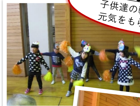
☆おかやまこども園様☆ 子供達の軽快な踊り！ 元気をもらいました！