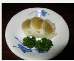
【鶏のゆずコショウ焼】