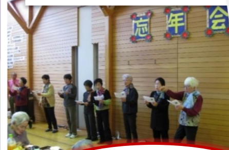
☆福島市はたち会様☆ 懐かしい曲を全員で合唱！