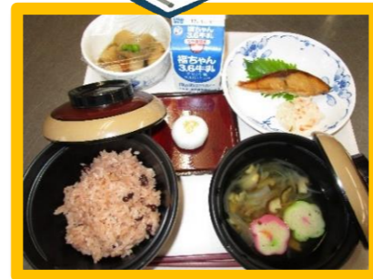
【お正月御膳】 食事でも利用者の皆様にお正月気分を感じていただきました!