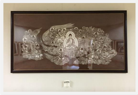
今回の展示作品の中で一番大きな作品。「阿弥陀聖衆来迎図(あみだしょうじゅうらいこうず)」。迫力があります！