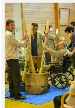
利用者の皆様、関根施設長も一緒に餅つき!みんなで掛け声をかけて盛り上がりました!