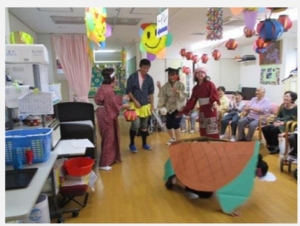
寸劇「浦島太郎」の様子