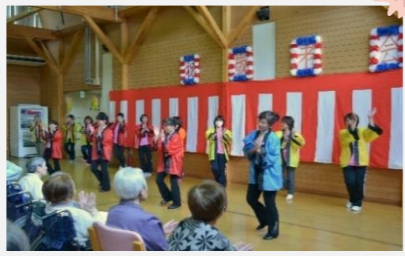
大波ジャディスクラブ様によるダンス