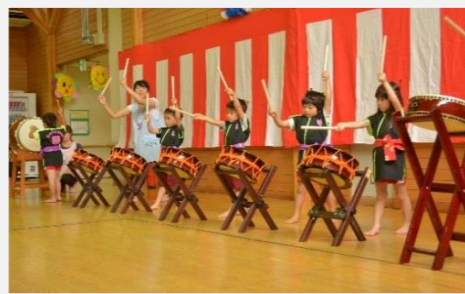
おかやまこども園、園児の皆様による太鼓演奏